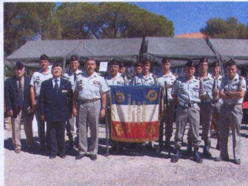
Le GDI de MARNHAC pose fièrement aux côtés de son bataillon de soutien et des anciens du 22 RIC venus en nombre pour l'occasion