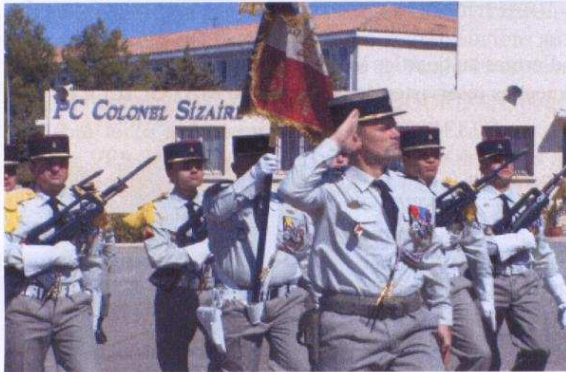
Le chef de corps et la garde au drapeau défilant sur la place d'armes du 21 ème RIMa.