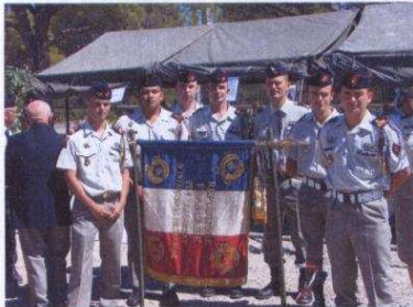
Le chef de corps et les caporaux-chefs du 22 o devant le drapeau.