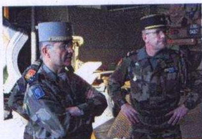
Le MAJ LECLERC (à gauche), puis l'ADC POITEVIN (à droite), recevant chacun le COMRINO dans leurs locaux.

L'occasion pour lui de rencontrer les personnels sur leur lieu de travail.