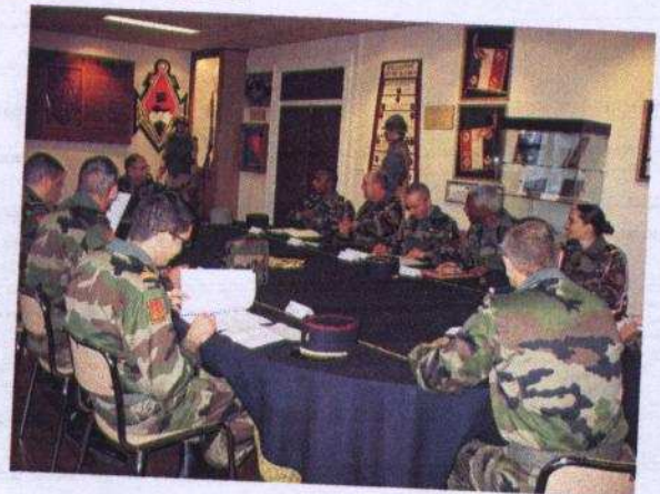
Table ronde sous-officiers dans la salle d'honneur.

Le bataillon a accueilli l'Inspection de l'armée de terre les 6 et 7 novembre dernier. Cette inspection qui a lieu tous les 2 ans permet au commandement de contrôler l'application des directives et de faire un point sur les difficultés rencontrées. C'est également l'occasion d'un contact privilégié avec les différentes catégories de personnels.