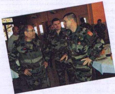
Pause déjeuner au point de restauration Mellinet.