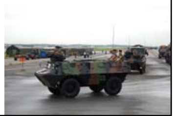
Place de l'étoile