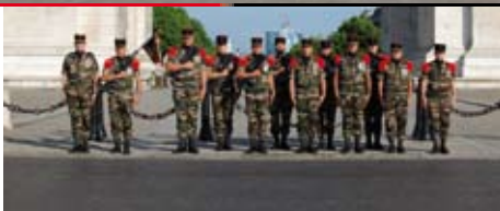
Sur les Champs Elysées ...