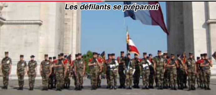
Les défilants se préparent