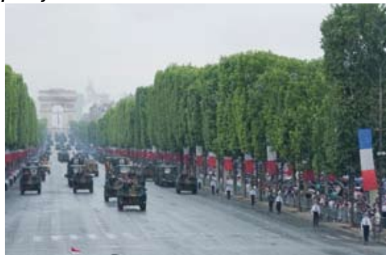
... sous le déluge