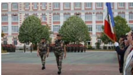
Cérémonie de rentrée

Comme chaque année, l'été aura été riche en changements avec en particulier la prise de commandement de six commandants d'unité. Le régiment est aujourd'hui sur sa structure à 10 compagnies, 8 professionnelles et 2 de réserve.