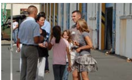
Accueil des nouveaux arrivants

Simultanément, il s'agit maintenant de poursuivre notre effort de recrutement pour arriver sur nos effectifs avec deux jeunes sections EVAT incorporées en octobre et une en décembre qui réaliseront leur FGI au CFIM de la brigade à Coëtquidan ou à Meucon.