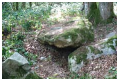
La zone de fouille après