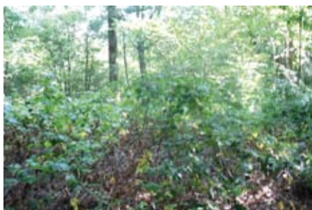
La zone de fouille avant

Le 01 er septembre, le personnel de l'infra s'est rendu sur le terrain militaire de La Ferrière-de-Flée pour y rechercher une tombe mégalithique.