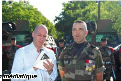
Le tourbillon médiatique